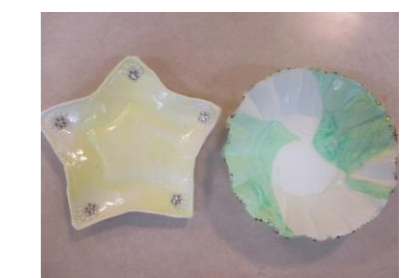
紙粘土の小物入れ