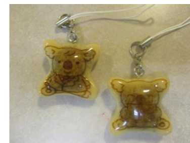
コアラのマーチのストラップ