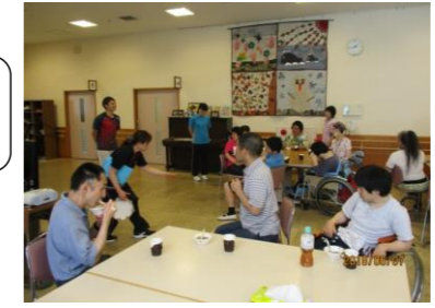
ところてん準備がんばります!!